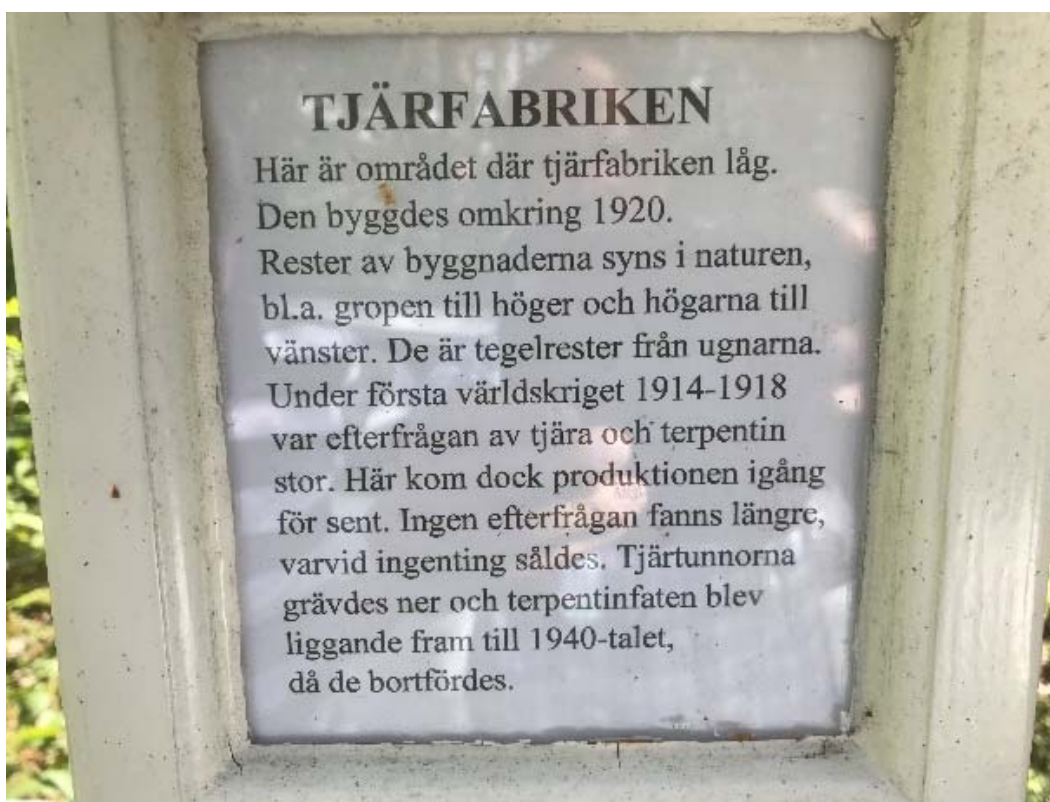
Bild 3 Skylten vid Eldris Tjärfabrik. Det är oklart var skyltens uppgifter kommer ifrån.

Eldris tjärfabrik låg ca 200 meter norr om Vasaloppskontrollen (bild 1). När vi besökte lämningarna efter tjärfabriken den 31 juli 2018 fanns en liten skylt och ett betongfundament (bild 3-5)